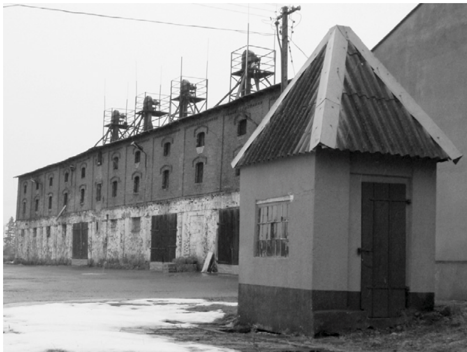
Ryc. 5. Naclaw, spichlerz (dawna stajnia koni roboczych) i waga.