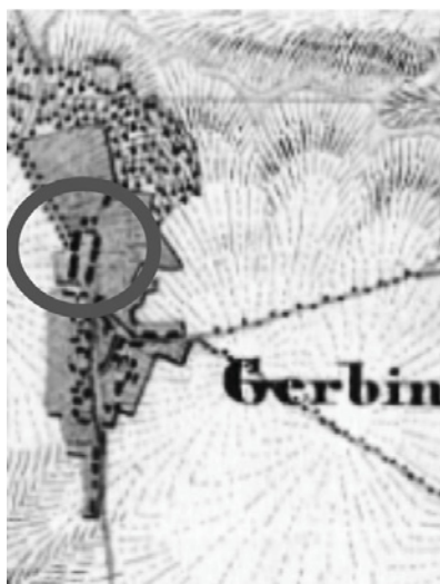
GARBNO - 1835 r.

nym) podwórzem gospodarczym (np.: Cetuń, Naclaw, Rzeczyca Wielka, Świerczyna) oraz koloniami mieszkalnymi dla robotników rolnych przy drogach wiejskich.