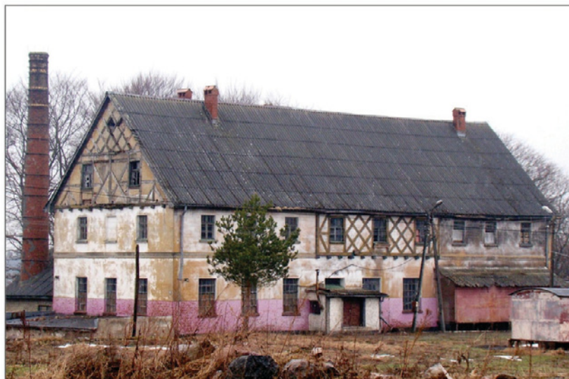
B. Cetuń, gorzelnia. Fot. W. Witek, 2010