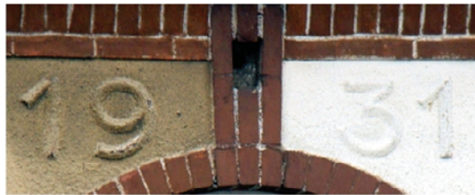
Świerczyna - dwojak

A. Datowniki i inskrypcje w budownictwie folwarcznym. Oprac. W. Witek