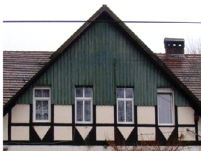
Cetuń - rządówka