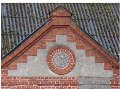
Bukowo - czworak