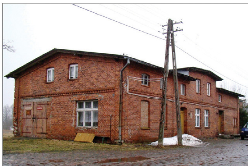
B. Świerczyna, dom rządcy. Fot. W. Witek, 2010