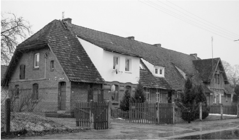
Ryc. 10. Krag, „sześciórak” (obecnie dom nr 11). Fot. W. Witek, 2010

chu. W ostatnim okresie budynki te są modernizowane, szczególnie w zakresie wymiany pokrycia dachowego, „docieplania” elewacji oraz wymiany stolarki okiennej i drzwiowej (w tym z nowymi, większymi otworami), przez co dochodzi do dekompozycji pierwotnych elewacji i zacierania historycznego charakteru.