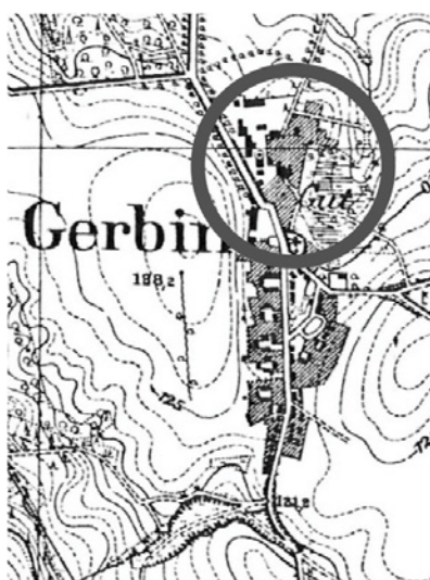
GARBNO - 1935 r.