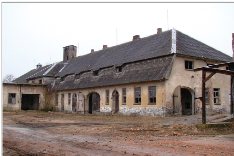
A. Kościernica, budynek wielofunkcyjny. Fot. W. Witek, 2010