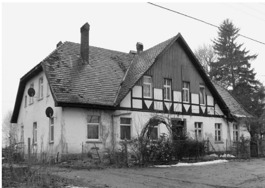
Ryc. 8. Cetuń, dom rządcy (obecnie dom nr 4). Fot. W. Witek, 2010

Na szczególną uwagę zasługują domy rządcy w Cetuniu, Świerczynie i Wietrznie, o okazałych formach architektonicznych, z elementami pierwotnego wystroju. W Cetuniu jest to obiekt wzniesiony w latach 10. XX wieku (Ryc. 8), ulokowany przy drodze wiejskiej (w osi wjazdu do pałacu). Budynek był murowany z cegły ceramicznej, z ryglową wystawką, nakryty dachem naczółkowym, z sześciosiową fasadą. W budynku mieściło się mieszkanie zarządcy, kancelaria, a na poddaszu pokoje dla praktykantów. W Świerczynie (Tab. II: B) budynek