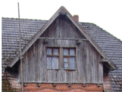
Krąg - czworak