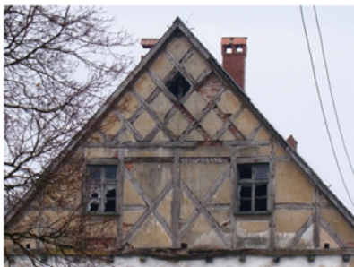
Cetuń - gorzelnia