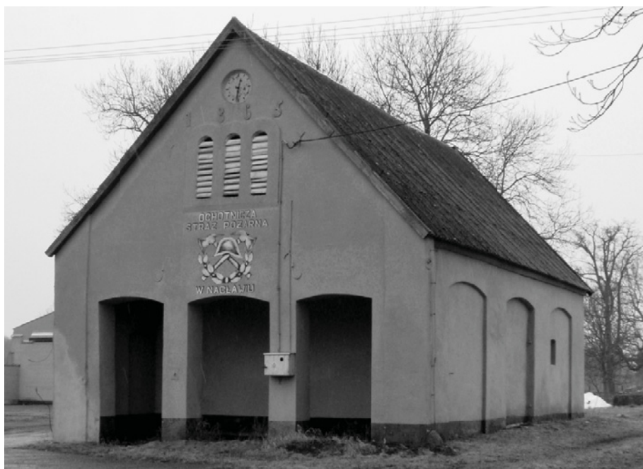
Ryc. 6. Naclaw, kuźnia folwarczna (obecnie OSP). Fot. W. Witek, 2010

W osi wjazdów na podwórze, w sąsiedztwie bram, umieszczone były wagi (np. Naclaw, Świerczyna – Ryc. 7). Są to małe, z jednym wnętrzem budynki wzniesione w latach 20. i 30. XX wieku, murowane, nakryte daszkami dwuspadowymi lub kopertowymi.