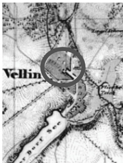
WIELIN - 1839 r.