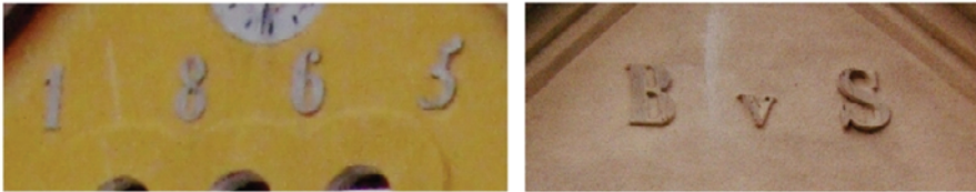
Naclaw - kuźnia