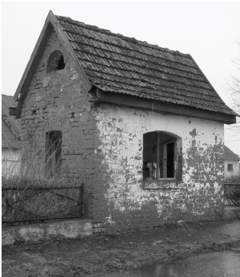
Ryc. 7. Świerczyna, waga folwarczna.

Od lat 20. XX wieku na obrzeżach podwórzy lokowano trafostacje (np. Gilewo, Naclaw, Rzeczyca Wielka). Są to budynki o wieżowych formach architektonicznych, ceglane, nakryte daszkami dwuspadowymi lub kopertowymi.