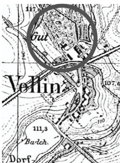
WIELIN - 1935 r.