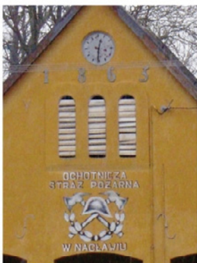
Naclaw - kuźnia