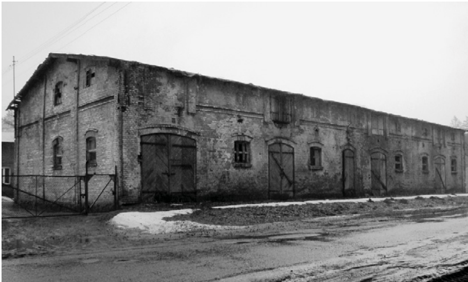
Ryc. 4. Domachowo, stajnia koni wyjazdowych, chlewnia. Fot. W. Witek, 2010

Jak wspomnieliśmy, stajnie, a zwłaszcza stajnie koni wyjazdowych, znajdowały się w bezpośrednim sąsiedztwie dworu lub budynku rządcy. Konie do jazdy wierzchem lub w zaprzęgu były elementem prestiżu i dumy właścicieli majątków, stąd duża dbałość o zaplecze inwentarskie oraz fachową obsługę. Konie były również główną siłą pociagową do prac polowych, wspieraną przez woły, z czasem zastępowane przez maszyny rolnicze. Dawne stajnie pełniły również funkcje garażowo-warsztatowe.