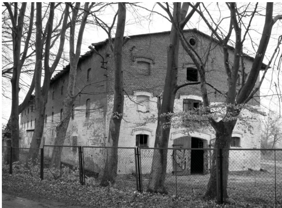
Ryc. 3. Garbno, obora folwarczna ze spichlerzem.

kowe lub bielone; obora w Cetuniu z pustaków, obora w Krytnie o konstrukcji kamienno-ceglanej (pierwotna owczarnia po przebudowie), obora w Wielinie o ścianach ceglano-drewnianych. Elewacje odznaczają się regularnymi podziałami wyznaczonymi przez naprzemienny rytm drzwi i okien, z wyłazami na poddasze. Dekorowane są gzymsami nadotworowymi i międzykondygnacyjnymi; w szczytach sporadycznie występują datowniki (np. Garbno – 1893 i 1927).