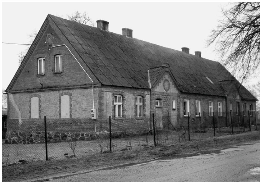
Ryc. 9. Bukowo, „czworak” (obecnie dom nr 10). Fot. W. Witek, 2010

Budynki mieszkalne są wzniesione z cegły ceramicznej (w Kościernicy i Kragu z częścią ryglową – Ryc. 10). To obiekty parterowe, nakryte wysokimi dachami dwuspadowymi (w Garbnie, Kragu i Świerczynie dachy naczółkowe), z użytkowymi (w tym mieszkalnymi) poddaszami. Elewacje zaakcentowano ceglаныmi gzymsami, obramieniami otworów okiennych i drzwiowych oraz elementami historycznej stolarki. W szczytach sporadycznie występują datowniki (np. Dadzewo, Garbno, Naclaw). Budynki założone są na planie regularnego prostokąta o zróżnicowanych – w zależności od typu domu – wymiarach. W Chocimlinie do „dworaków” przylegają budynki gospodarcze, tworząc jednorodną formę architektoniczną. Rozplanowanie wnętrza wykazuje dużą jednorodność co do liczby i wielkości pomieszczeń mieszkalnych. Z reguły są to: dwa pokoje (izby), kuchnia, komora (obecnie łazienka) i sień-korytarz ze schodami na poddasze. Wnętrza budynków mają zwykle układ dwutraktowy, regularny, z przechodnimi pomieszczeniami. Wejścia umieszczone są w ścianach długich (w tym z podcieniami, np. Domachowo) oraz w szczytach (np. Garbno, Kościernica, Krag).