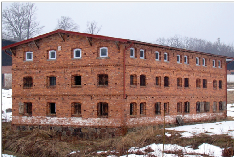
A. Wielin, spichlerz. Fot. W. Witek, 2010