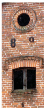
Garbno - obora