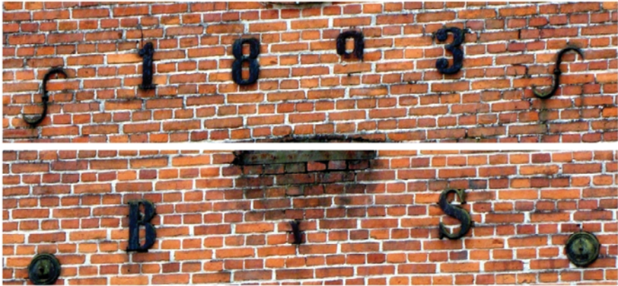
Garbno - obora